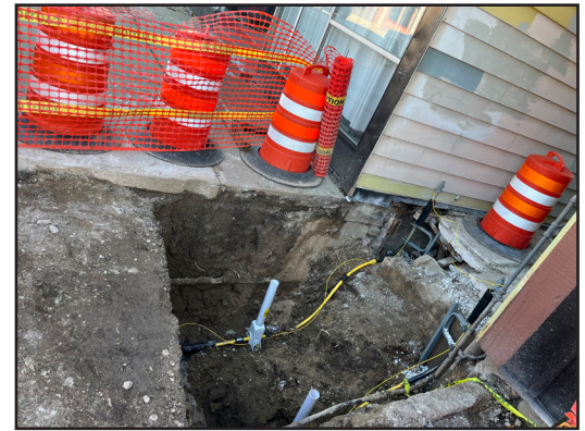
We Gas relocations in progress between 36th and 37th streets

Currently, relocations are in progress between 39th and 27th streets for the 2026 segment of the project. Several utilities are beginning to complete relocations (We Gas, We Electric, AT&T, Everstream, Verizon). Right now, Five Star Energy Services is working on the corridor on behalf of We Gas. Other utilities are anticipated to begin work at the end of 2025 and the beginning of 2026.